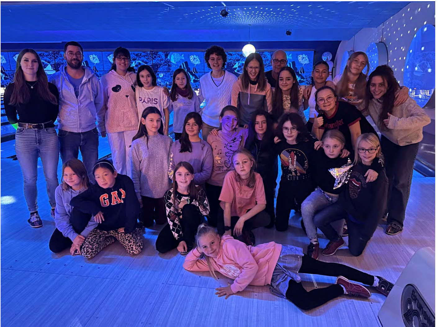
Weihnachtsfeier der D- und C-Juniorinnen beim Bowlen am 03.12.2022