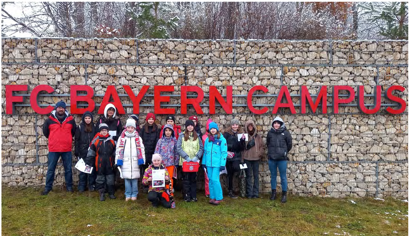
Besuch der D -Juniorinnen im Bayern-Campus am 10.12.2022